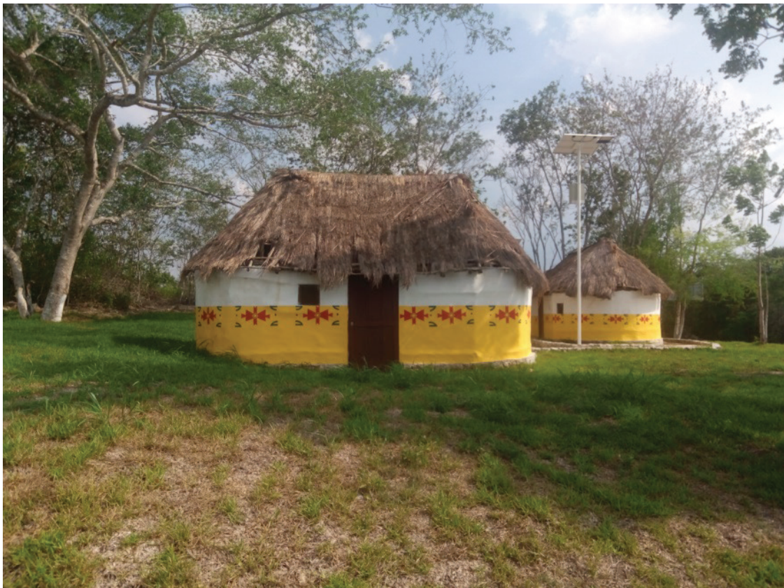
Figura 2. Venta de tierra ejidal para el sector privado