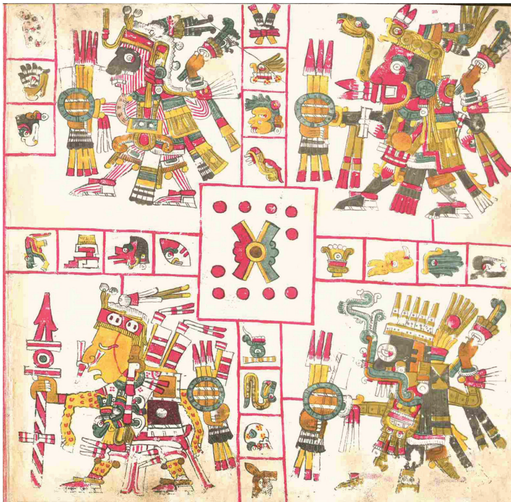
Figura 3. Las cuatro secciones del calendario en la cruz

También, como parte indisociable del constructo del monte — altepetl, gíaj, kah 2 — está que, en su interior, reside la esencia de las cuatro grandes manifestaciones de la energía vital de la tierra: las estaciones del año, generadas por las fases del planeta en torno al sol. Estas esencias se conceptualizaban como los cuatro corazones de la tierra, señores del rayo y jaguares de la montaña (Melgarejo, 1990), pero en realidad se trata de las cuatro posiciones en la órbita de la tierra: solsticio de invierno, equinoccio de primavera, cénit y equinoccio de otoño, con lo que a cada una corresponde regir las cuatro secciones del calendario Tonalpohualli o Biye (De la Cruz, 2007). Cabe señalar que esta reiterada presencia de cuatro direcciones en torno a un eje, hizo de la cruz una de sus representaciones simbólicas más replicadas (Figura 3).