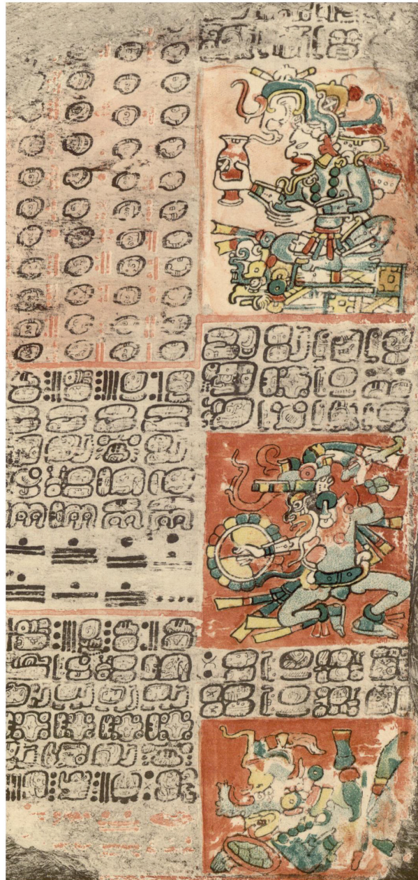
Figura 1. Ciclo de la Gran estrella

ca” y mostrar la prolongada persistencia en el uso de la misma iconografía entre élites de culturas separadas al menos por 2200 años, una gran distancia geográfica y troncos lingüísticos completamente distintos (Williams, 2009).