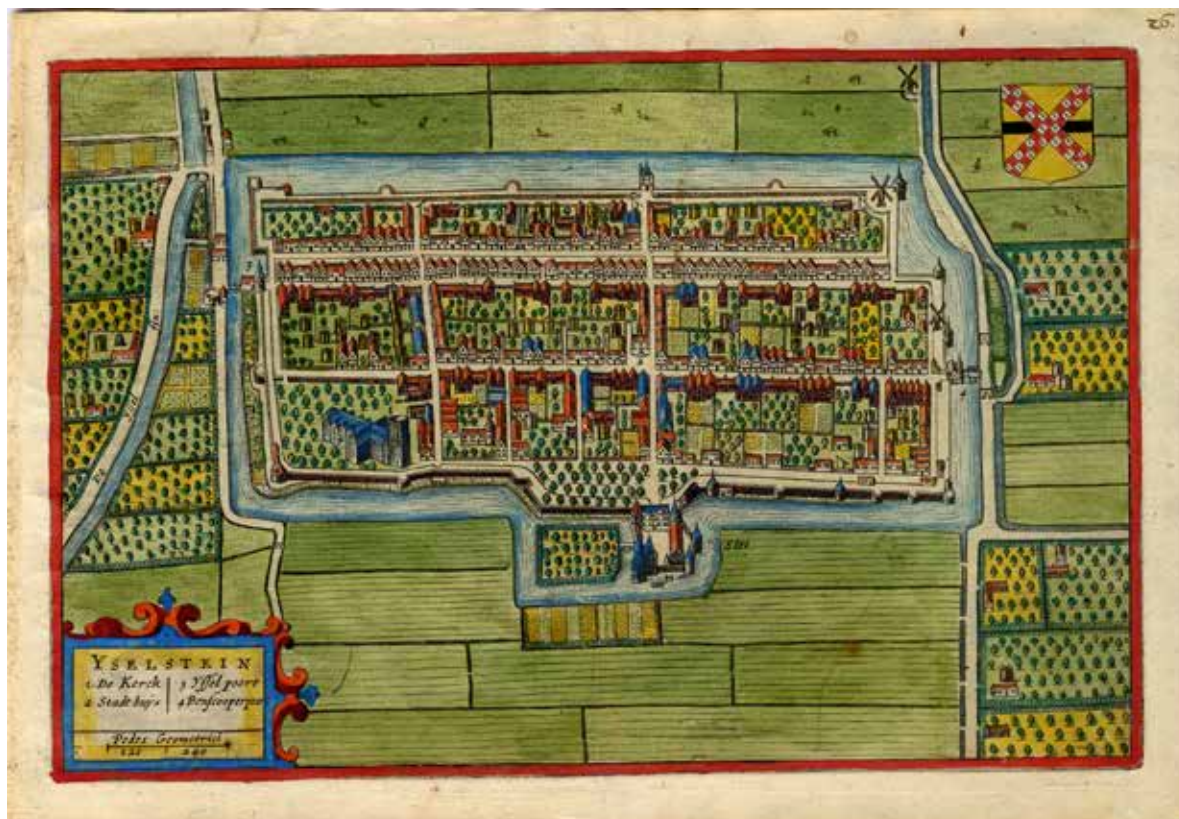
Lámina 4. Plano de la villa flamenca de Yselstein. Hondius, 1634.

Para terminar con esta sección, queremos traer a colación los comentarios de los cronistas sobre que varios de los casos se asemejaban a poblaciones flamencas, y razones para hacer esta comparación no les faltaron, pues una mirada rápida a la cartografía de la zona nos muestra las mismas características en cuanto a la localización y representación del espacio productor de alimentos: los huertos en el centro rodeados de casas como se muestra en los casos de Asperen, Gouda, Yselstein.