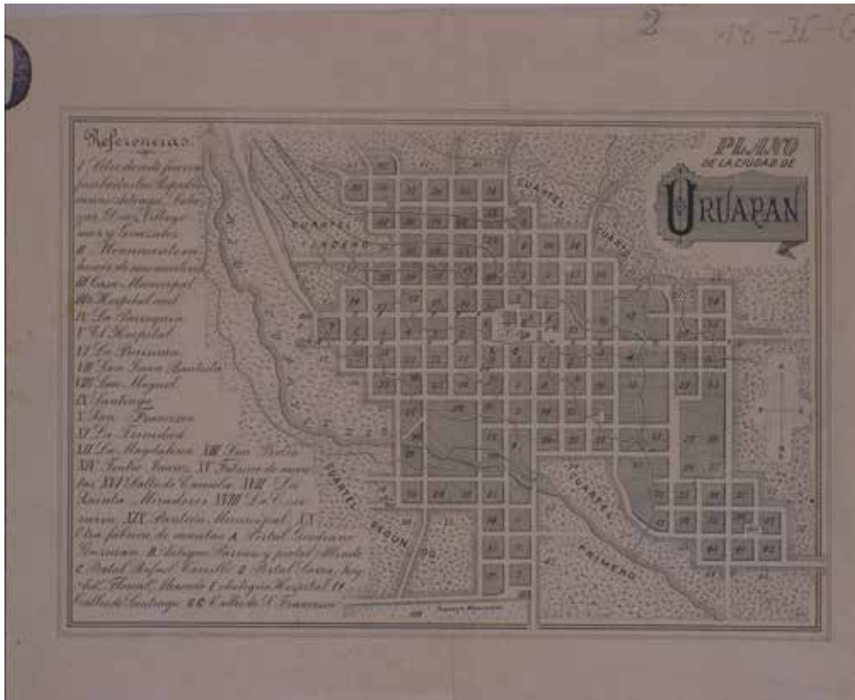
Lámina 1. Plano de la ciudad de Uruapan.