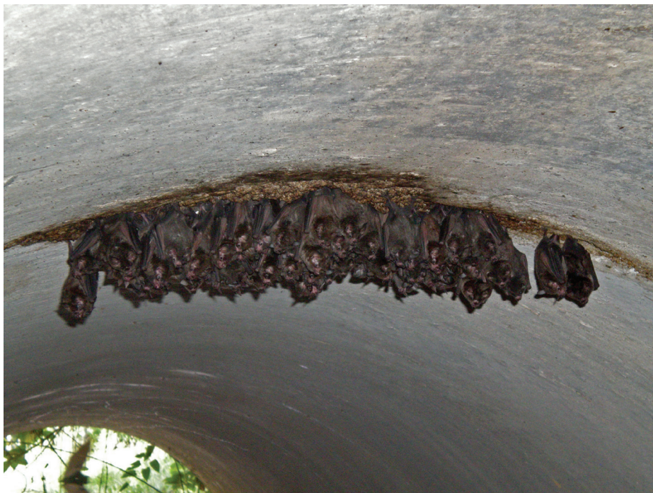
Figura 2. Colonia de murciélagos frugívoros Carollia sowelli perchados en un túnel de una carretera en Chiapas