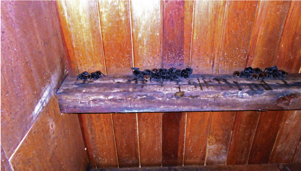
Figura 1. Colonia de murciélagos insectívoros, Myotis pilosatibialis perchados en el techo de una vivienda en Chiapas