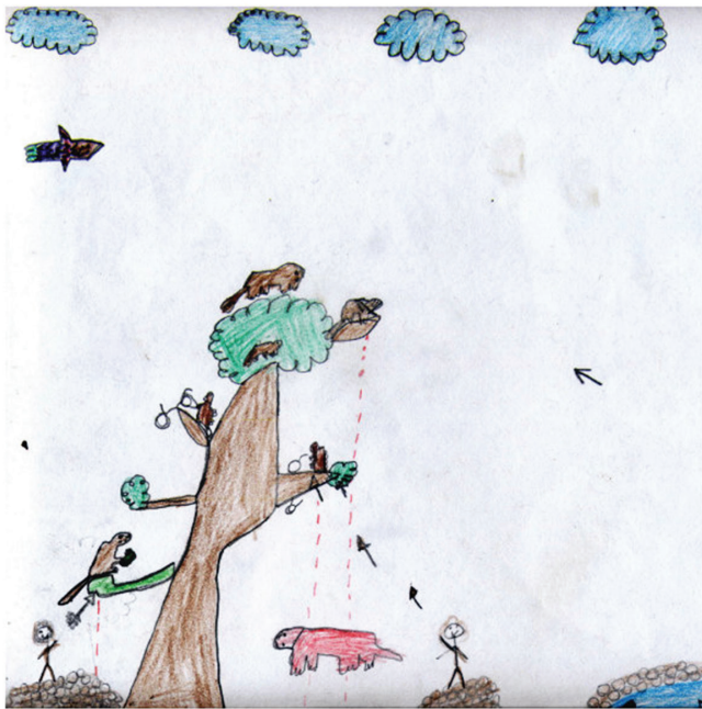
Figura 3. Los perros representan un problema para los monos en las comunidades