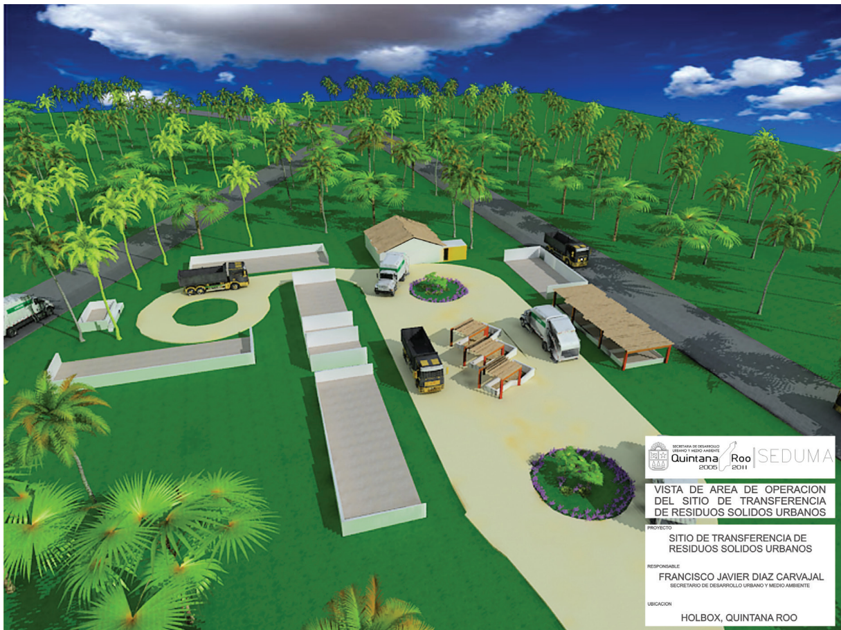
Figura 2. Diseño del sitio de transferencia de Isla Holbox. Rodeado de plantas costeras, destacan distintos contenedores de residuos reciclables y composteros para el máximo aprovechamiento de los residuos valorizables

El estudio realizado permitió obtener un panorama más claro sobre el tipo, volumen, peso volumétrico y características de los residuos sólidos y sus generadores. Con base en esta información, Yaax Beh A.C. realizó el diseño del sitio de transferencia de isla Holbox y las necesidades de equipamiento, sistema de recolecta y procedimientos acordes al tipo y volumen de desechos (figura 2).