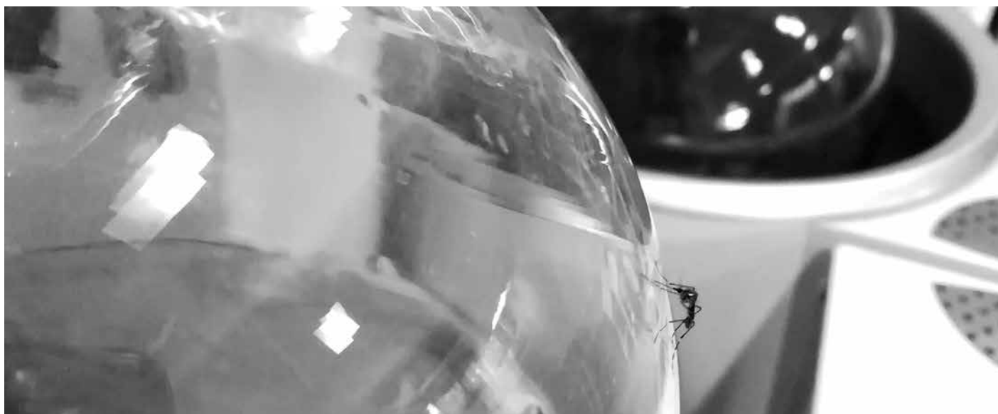
Mosquito posado sobre un rotavapor (instrumento para destilación), mientras se obtienen extractos de una planta con posible actividad antimalárica: Cecropia Obtusifolia Bertol. Centro de Investigación Biomédica del Sur CIBIS IMSS, Xochitepec, Morelos, México.

El 25 de febrero de 2021, El Salvador se convirtió en la primera nación centroamericana que obtuvo el reconocimiento como país libre de malaria. De acuerdo con especialistas, fue gracias a que el trabajo se enfocó en el control y eliminación del vector, a la descentralización de los laboratorios para lograr el diagnóstico oportuno de la enfermedad directamente en las zonas afectadas, al acceso a tratamientos y a la integración de la población en las medidas de control e identificación mediante brigadas y capacitaciones. Con todo esto, la gente cuenta con mayor información y ya no necesariamente debe viajar a las cabeceras municipales o a los hospitales de las grandes ciudades para ser atendidos a tiempo.