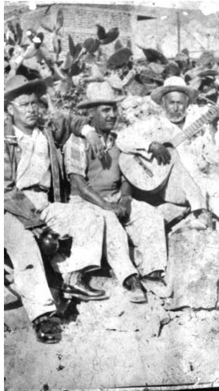
Bisabuelo Ne con la guitarra.

Mis abuelos tuvieron que abandonar su pueblo, parte de su familia y sus costumbres, con la esperanza de superar su pobreza. La suma de las difíciles condiciones estructurales, el machismo y la relación conflictiva campo-ciudad los despojaron de sus formas de vida para entrar a la dinámica urbana; sin embargo, la vida rural era tan importante para mi abuela, que en sus