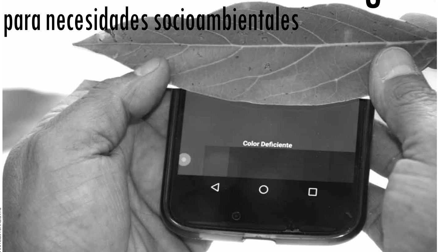
ANA LIDIA SANDOVAL

Aplicación AppAguacateN en la que se compara el color de las hojas del árbol de aguacate con un patrón de colores, lo que indica el contenido aproximado de nitrógeno en la hoja.