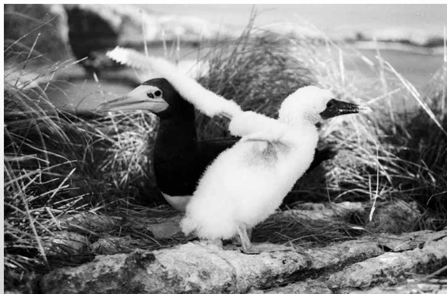
MÓNICA GONZÁLEZ JARAMILLO

El invierno es la época de abundancia en las aguas de la isla. Los rabihorcados ponen solo un huevo por pareja en cada temporada reproductiva y por lo tanto producen un solo pollo; en general, pueden criar con éxito al menos 20 de cada 100 polluelos nacidos entre enero y abril, lo que para las aves marinas representa la tasa de reproducción promedio. A diferencia de los rabihorcados, las especies de rabijuncos, gaviotas, charranes, pelícanos y bobos ponen de dos a tres huevos y crían con éxito hasta dos de tres pollos en una buena temporada reproductiva (cuadro 1).